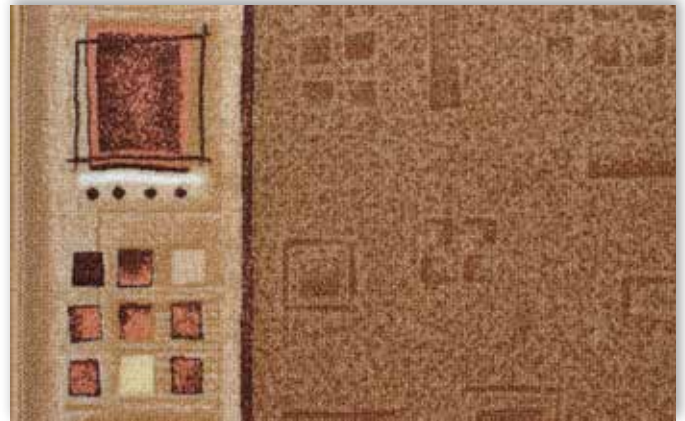
35 67cm + 80cm + 100cm + 120cm