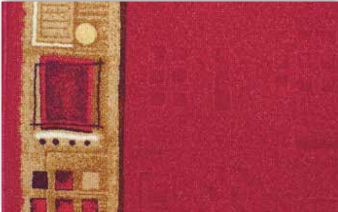
10 67cm + 80cm + 100cm + 120cm