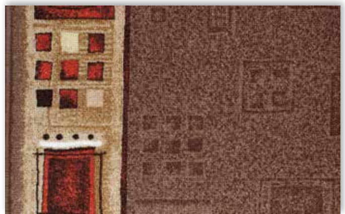
44 67cm + 80cm + 100cm + 120cm

La société Associated Weavers se réserve le droit de modifier les caractéristiques de ce produit tout en conservant les mêmes qualités techniques. Il est fortement conseillé d'utiliser les coloris moyens et foncés pour les pièces à grand trafic.