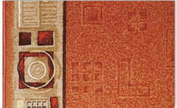
84 67cm + 80cm + 100cm + 120cm