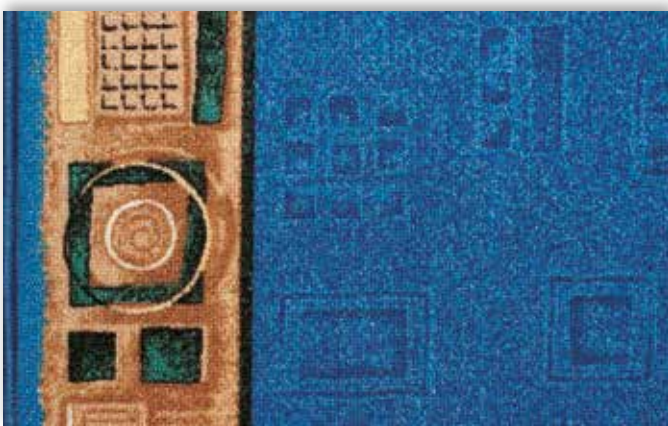
77 67cm + 80cm + 100cm + 120cm