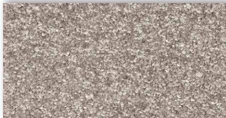
49 4m + 5m