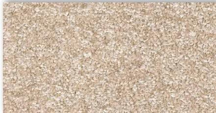
33 4m + 5m