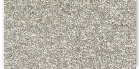
90 4m + 5m