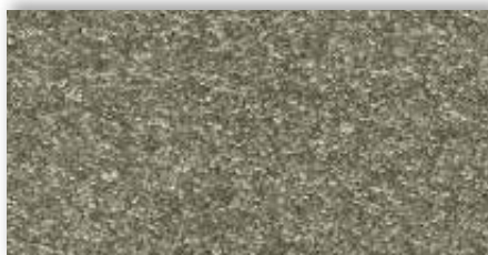
20 4m + 5m

La société Associated Weavers se réserve le droit de modifier les caractéristiques de ce produit tout en conservant les mêmes qualités techniques. Il est fortement conseillé d'utiliser les coloris moyens et foncés pour les pièces à grand trafic.