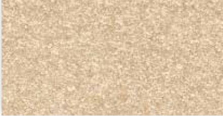
32 4m + 5m