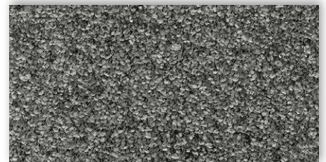
98 4m + 5m