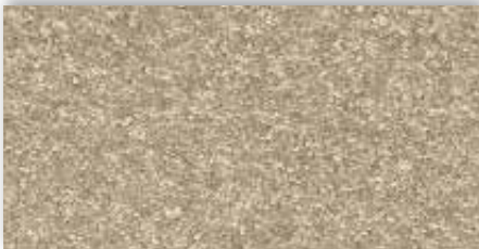
37 4m + 5m