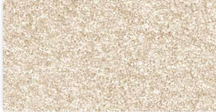
30 4m + 5m