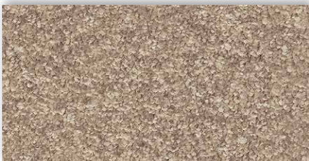
35 4m + 5m