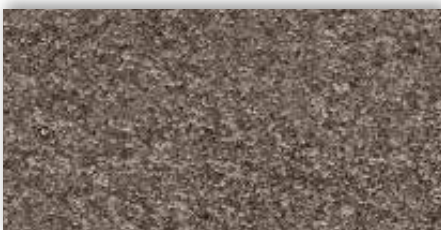
97 4m + 5m