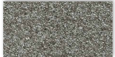
95 4m + 5m